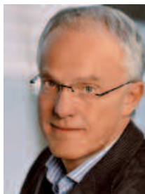
Dr. Jürgen Rüttgers

Die CDU Nordrhein-Westfalen hat den Startschuss für eine große Schulkampagne gegeben. Es ist eines der Kernziele der Landesregierung, dass jedes Kind seine Chancen und Talente nutzen und entfalten kann – und zwar unabhängig von seiner Herkunft. Hierzu dient vor allem das Prinzip der individuellen Förderung, die erstmalig im Schulgesetz als Recht verankert wurde. Chancengerechtigkeit ist nicht abhängig von der Schulstruktur, sondern von dem Unterricht, der in dieser Struktur erteilt wird. Mit unserer Kampagne wollen wir unterstreichen, dass wir für Realschulen, Hauptschulen und Gymnasien stehen. Nicht mehr Ideologie, sondern mehr Lehrer, mehr Ganztage und mehr individuelle Förderung ist die Antwort – und die geben nur wir.