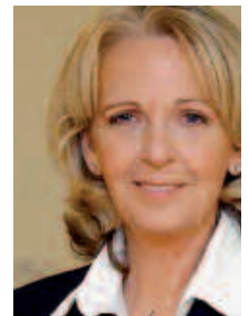
Hannelore Kraft, Landes- und Fraktionsvorsitzende der SPD NRW

Bildungsforscher, Wirtschaftsfachleute, Vertreter von Kirchen und Verbänden sind sich einig: Der Schlüssel zur Bildung liegt im längeren gemeinsamen Lernen und einer individuellen Förderung. Die Kommunen, deren Schulen schon heute wegen der zurückgehenden Schülerzahl ums Überleben kämpfen, fordern: Die Austrocknung ihrer Schullandschaft muss verhindert werden. Und auch die Eltern wollen für ihre Kinder ein wohnortnahes Schulangebot für alle Bildungsgänge. Deshalb setzt sich die SPD-Landtagsfraktion für eine Gemeinschaftsschule ein.“